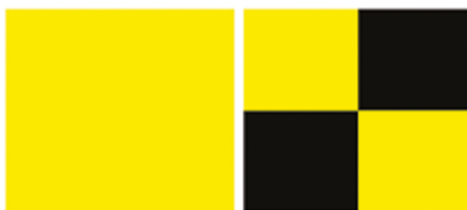
Le Pavillon de quarantaine

Après 2 ans de mise en quarantaine, Grand Largue a pu amener le pavillon QL, c'est un soulagement pour tout le monde.